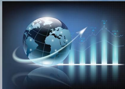
Bachillerato Bie de Ciencias Sociales