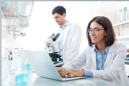
Bachillerato Bie Científico

Vinculado a una de las modalidades de Bachillerato; sólo puede cursarse desde esa modalidad