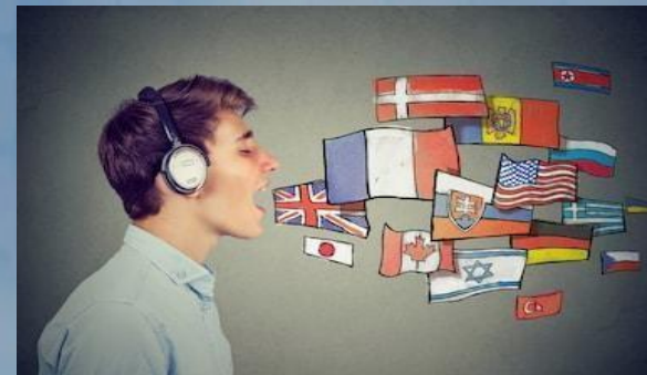
Bachillerato Bie de Idiomas

Refuerza una de las áreas del Bachillerato (en nuestro caso, los Idiomas) por lo que puede realizarse desde cualquier modalidad de Bachillerato: Ciencias, Sociales y Humanidades